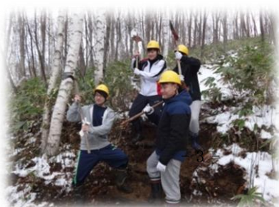
完成した階段の前で

階段を作ることで小学生など森に来る方々が安全に森を歩くことができるようになりました。人のために活動することができ、とても良い経験になりました。そして昼食後には、木や森についてお話をさせていただきました。木は葉だけが呼吸をしているのではなく、幹でも呼吸をしていること、森林が環境にどのように影響しているのかを学びました。薪割りは初めての体験で、鉋や機械で薪を割りました。普段の生活で出来ないようなことを初めて体験でき、とても良い経験になりました。