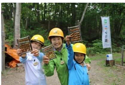
遂に完成したドングリそろばん！