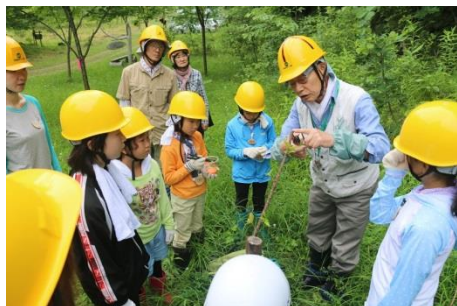
傷んだ木の手当てをする

最初に炭焼き窯の構造と炭のでき方の説明を聞き、無事成功を神様に祈ってから隊員全員で窯にお神酒を注ぎトーチで火をつけました。夏の森歩き学習の前半は木の病気・虫害・獣害の話