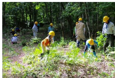
親子で下草刈り体験