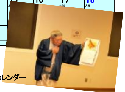
忘年会会場で披露されたカレンダー