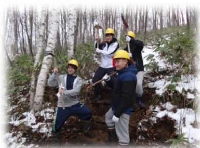
完成した階段の前で

階段を作ることで小学生など森に来る方々が安全に森を歩くことができるようになりました。人のために活動することができ、とても良い経験になりました。そして昼食後には、木や森についてお話をさせていただきました。木は葉だけが呼吸をしているのではなく、幹でも呼吸をしていること、森林が環境にどのように影響しているのかを学びました。薪割りは初めての体験で、鉋や機械で薪を割りました。普段の生活で出来ないようなことを初めて体験でき、とても良い経験になりました。