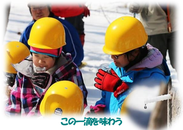
この一滴を味わう

●(子どもから) 初めて木を植えたとき、周りにあるような大木になったらすごいなぁと感じました。ずーと先の事ですが、地球温暖化も進んでしまっているので、植樹を沢山していきたいです。他にもホタルのきれいなかすかな光を見たり、化粧炭やコースターを作ったり、木の高さや太さを測ったことも印象に残っています。今までの森を育てるという体験を経験にかえ、しょう来に役立てていきたいです。作った物などにはおいがよく一生使える物なので、環境にもやさしく、とてもいいなと思っています。これからも森林や自然遺産、環境、林業などについて、もっと学んでいきたいです。二年間、森