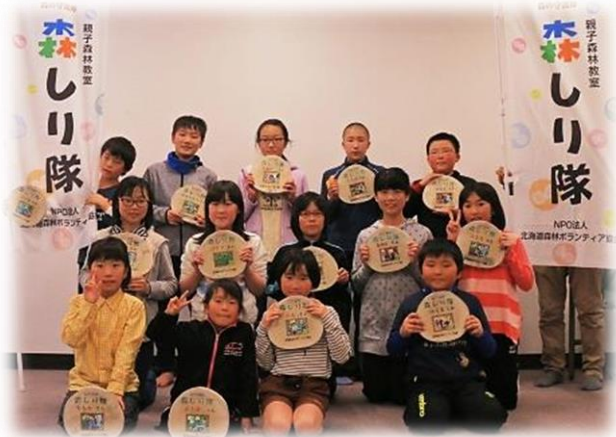
修了証を手にした第二期森しり隊員たち

例えば、バーニングベンでのネームプレート作り、原始的な火起こし、化粧炭、手作りカンジキ、初めて食べたコクワ、間伐作業などです。2年目はクリが不作だったことで森が生きている事、森の役割や食物連鎖の事、少し解りました。子どもたちが大人になった時に今の自然がそのまま残っている様に子どもたちの記憶に残したいです。私は種の3W (water、wing、wildlife) を覚えました。家で育てているアオダモの木は、息子が野球をしているのでバットにできる程大きく大切に育てたいと思います。最後に、親子で貴重な経験をさせていただきありがとうございました。皆さん、いつまでも健康でお過ごしください。HPなどで活動を見守り、陰ながら応援しています。