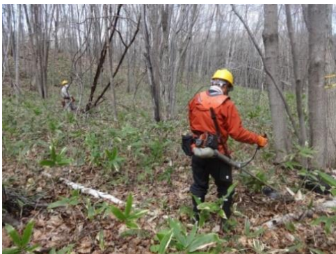
マイツリー地の笹刈り(5月7日)

ルートから予定地に入ることを検討しています。紅桜公園敷地内及び駐車場の利用については事前に責任者に了承を頂いております。それと昨年、光塩学園平岡校舎前の市道でクマの目撃情報もありますので、活動にあたっては事前に十分な安全確認が必要になると思います。