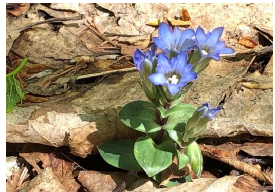
写真/三橋・C-4区の作業道沿道

2年草で種は雨が降ると流されて、たどり着いた所で冬を越し、翌年開花します。この道は笹を刈った後チップを敷き込み日当たりも良くて、今年も又会えるか楽しみです。(文・西野(澄))