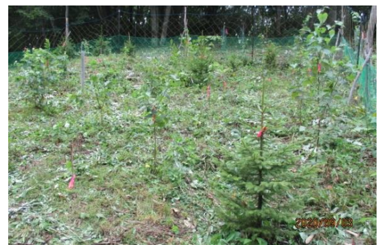
「囲い網」の内部状況