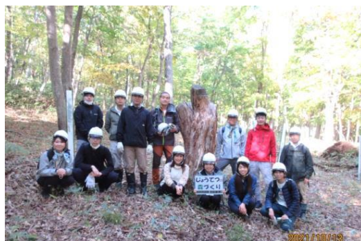
今年度は6月に植栽地の草・笹刈りをして、8月に地存え、10月に植樹となりました