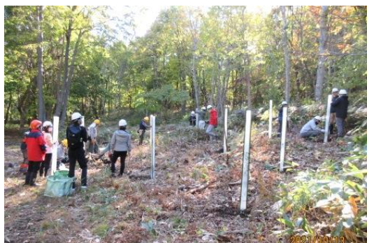
秋色に染まり始めた森での植樹風景

次回は年を越して、2月に雪の中で整理伐作業を行なうことを案内して、今日の活動を終了しました。