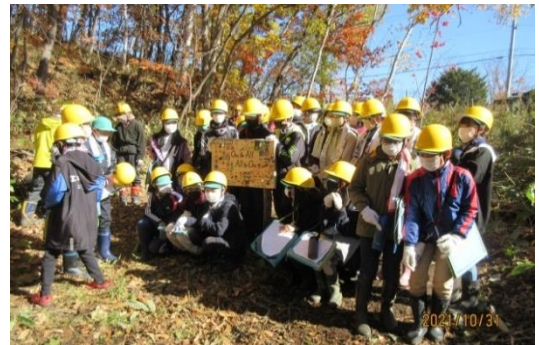
看板の前で記念写真