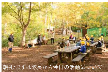
朝礼:まずは隊長から今日の活動について

去年体験した隊員もいましたが、みなさん！どうでしたか?? 紅葉(こうよう)の森の中での大運動会(だいうんどうかい)、楽しんでもらえたかな??いままで入ったことない森の中で待(ま)ってたいろいろなミッションに挑戦してもらったけど、みんなうまくクリアできましたね！各グループの結果は2ページの一覧表を見てください。 それでは、その日、その時を、写真でふり返ってみましょう！